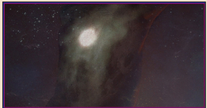
Body Moon , Outubro 2019