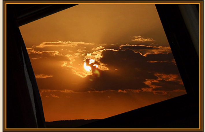
Lightning Outside , Janeiro 2019

É como se repentinamente o nosso corpo fosse alvo de uma descarga elétrica. E repentinamente o mundo ilumina-se. O nosso peito ilumina-se. O nosso corpo ilumina-se. E tudo parece ganhar beleza e significado.