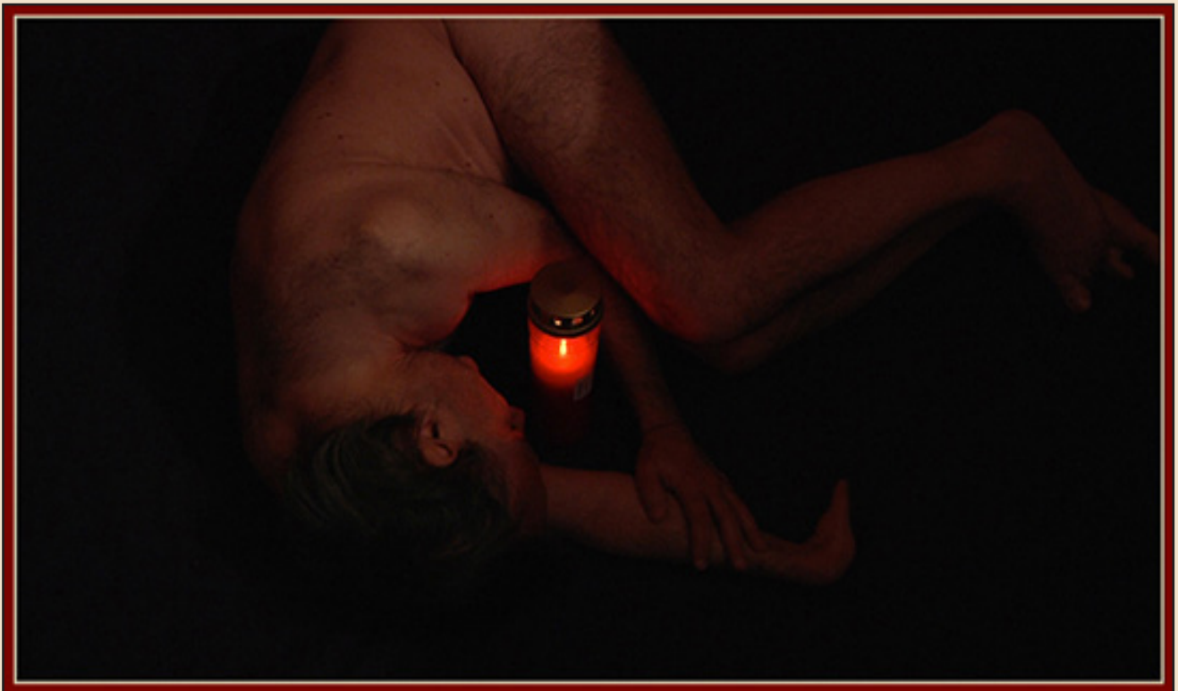
Embodied Flame , Fevereiro 2019