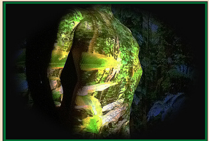
Vegetable Adam , Janeiro 2019

o feio, onde existe o bem, existe também o mal. O mundo abre-se-nos como um enorme corredor em que cada porta tem sempre dois significados, ou dois caminhos contrários. Onde existe prazer, existe irremediavelmente dor. Onde existe luz, há seguramente sombra.